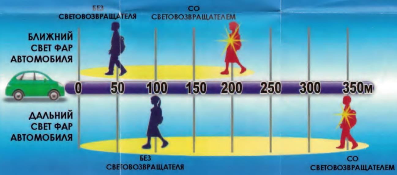
Дальность обнаружения человека водителем автомобиля

Памятка поможет вам в разработке системы обучения детей и подростков основам Правил дорожного движения, в формировании у них необходимых умений и навыков безопасного участия в дорожном движении.