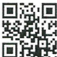
Универсальный тематический классификатор